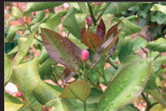
Fioritura degli agrumi

È un antico incrocio tra albicocco e mirabolano. Alcune fonti dicono che la sua ibridazione avvenne a opera dei monaci agostiniani attorno al 1600. Questo frutto è comunque già citato nel 1755 dai monaci Nolin e Blavet, vivaisti nella certosa di Parigi, che lo denominarono Apricot violet . Dal 1768 il Duhamel lo definì apricot noir o apricot du pape . Il biricoccolo secondo il Duhamel ha un sapore squisito, che ricorda l'albicocca e la fragranza di una susina cino-giapponese (ma Giorgio Gallesio è di diverso avviso, ritenendo il suo gusto "mediocre"). Il colore della polpa è rosso aranciato