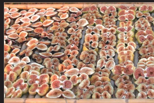
Essiccazione dei fichi