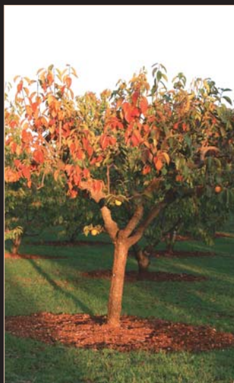
L'albero del kaki

essere il proprietario dell'ultimo esemplare di Lue rimasto in tutta la provincia di Piacenza e quindi in Italia. Ora gli esemplari sono in aumento, in quanto al conservatorio è iniziata la moltiplicazione vivaistica.