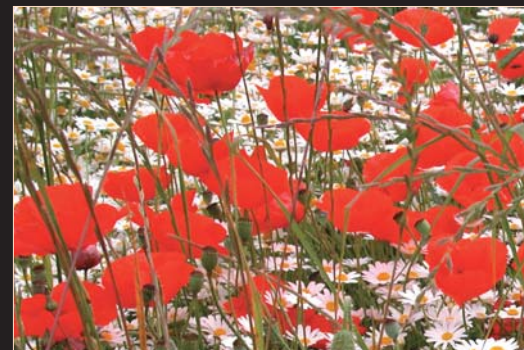
Campo con papaveri