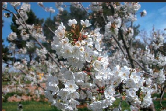
Ciliegio in fiore