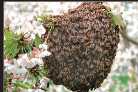
Uno sciame d'api

Il Fico Lupo (Lupo) è la pianta più rara del conservatorio e a massimo rischio di estinzione. Antica varietà unifera di fico nero piacentino (nero come il lupo nelle favole dei bambini), donato all'Autore da Agnes Roberti che, dopo trent'anni di ricerche, aveva assicurato di