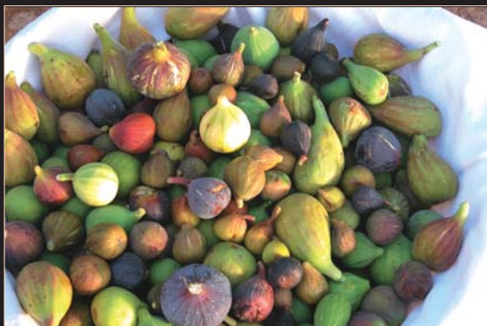
Un paniere di fichi