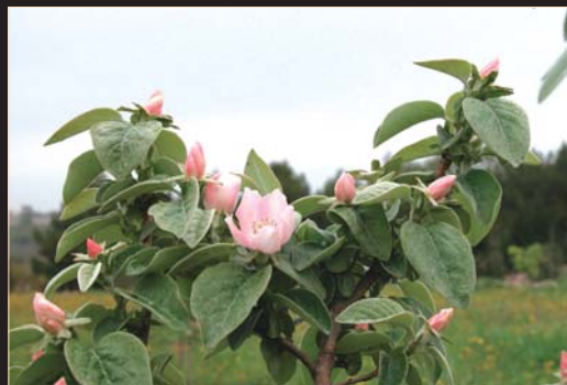
Cotogno in fiore

Percorsi per il riconoscimento della flora spontanea, tra cui le erbe eduli, si snodano sotto i grandi esemplari di Quercus trojana , altri permettono di raggiungere le collezioni in pieno campo di erbe aromatiche e i campi dove sono state seminate le varietà tradizionali di grano, Gentilrosso e