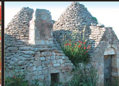
La caratteristica struttura del trullo