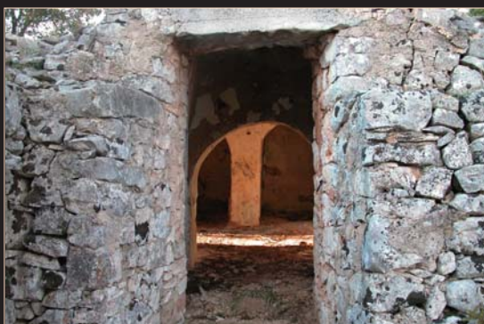
Un particolare di un trullo

Senatore Cappelli, e di farro, Triticum spelta e dicoceum .