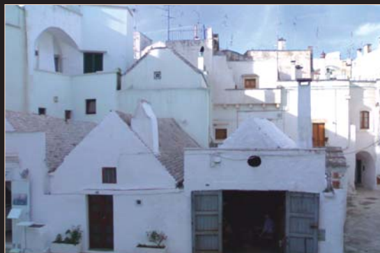
La Lama - Martina Franca